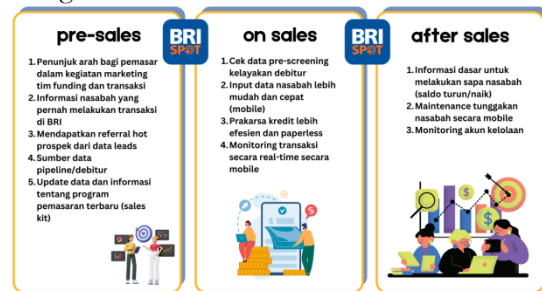
Gambar 2 Manfaat Aplikasi BRISPOT bagi Pemasar

dalam menjalankan tugasnya meliputi kemudahan dalam proses memprospek calon debitur melalui data leads yang tersedia yang kemudian menjadi hot prospek untuk di- follow up . Pada tahap berikutnya juga membantu proses akuisisi hingga monitoring dan maintenance nasabah secara online (mobile) hanya dari aplikasi yang ada di ponsel. Data-data yang diperoleh dari informan kemudian dilakukan reduksi dan klasifikasi data menghasilkan ikhtisar dari manfaat aplikasi BRISPOT bagi pemasar di BRI Probolinggo sebagai berikut: