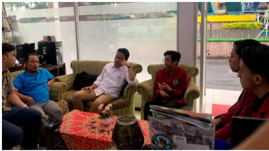
Gambar 1. Pendampingan Knowledge Sharing pada Karyawan TRS

Pendampingan pada karyawan TRS tersebut bertujuan untuk mendapatkan bimbingan dan informasi secara terstruktur tentang berbagai pengetahuan, keterampilan, dan praktik terbaik yang relevan dengan tugas dan tanggung jawab mereka di TRS. Pendampingan dan penyuluhan Knowledge Sharing bertujuan untuk meningkatkan pemahaman dan keterampilan karyawan dalam menjalankan tugas mereka dengan lebih efektif dan efisien, serta memfasilitasi pertukaran informasi antar mereka untuk memperkaya pengalaman dan pengetahuan kolektif di dalam organisasi. Pendampingan tersebut juga mencakup pelaksanaan kegiatan yang didampingi oleh tim mahasiswa.