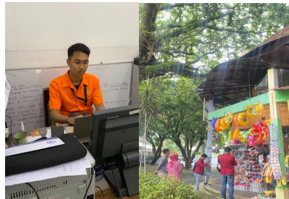
Gambar 2. Pendampingan pada UKM TRS dan SEO Karyawan TRS

Sengkaling. Optimasi Konten: Memastikan konten di situs web UKM Taman Rekreasi Sengkaling dioptimalkan untuk kata kunci yang relevan. Ini termasuk penggunaan kata kunci dalam judul, deskripsi, konten halaman, dan tag gambar. Optimasi Struktur Media Sosial dan memperbaiki struktur media sosial untuk memastikan navigasi yang mudah dan pengalaman pengguna yang baik. Ini mencakup penggunaan tautan internal yang relevan, pembagian konten ke dalam kategori yang logis, dan penerapan sitemap. Optimasi media sosial yang dioptimalkan untuk tampilan dan pengalaman pengguna yang baik di perangkat mobile, karena banyak pengguna mencari informasi melalui perangkat seluler. Pengembangan Konten Berkualitas: Membuat dan mempromosikan konten yang relevan, informatif, dan bermanfaat bagi pengunjung. Ini bisa berupa artikel, blog, video, atau foto tentang kegiatan dan fasilitas di Taman Rekreasi Sengkaling. Pembangunan Tautan: Membangun tautan link pada aktivitas yang ada pada Taman Rekreasi Sengkaling untuk meningkatkan otoritas domain dan peringkat pencarian. Praktik SEO bersama UKM Taman Rekreasi Sengkaling bertujuan untuk meningkatkan visibilitas online mereka, menarik lebih banyak pengunjung potensial, dan meningkatkan kehadiran online mereka di pasar yang semakin kompetitif.