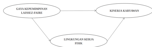
Gambar 1. Model Penelitian

kepemimpinan laissez-faire serta variabel intervening yaitu lingkungan kerja fisik.