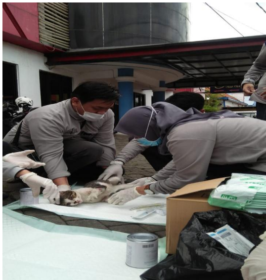
Gambar 2. Pengambilan Darah Kucing

Pada penelitian ini hasil nilai total protein pada kucing liar ( stary cats ) ditemukan ada 11 sampel total protein yang mengalami penurunan dan peningkatan (39%) dan 17 sampel dengan total protein yang normal (60,7%). Dari 11 sampel darah kucing dengan ada 4 sampel dengan nilai total protein yang mengalami penurunan bekisar 4,5-4,7 g/dL. Sedangkan 7 sampel mengalami peningkatan nilai total protein yaitu kisaran 9,1-10,1 g/dL.