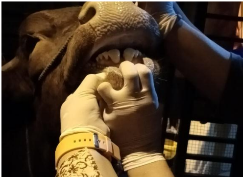
Gambar 1. Pemeriksaan gigi sapi untuk menentukan umur hewan. Sepasang gigi permanen menunjukkan sapi telah cukup umur untuk dijadikan hewan kurban

Rerata umur sapi yang diperiksa yaitu berumur 18-30 bulan, terlihat dari jumlah pasang gigi seri permanen yang telah tumbuh. Sedangkan umur rata-rata kambing dan domba yaitu 18-24 bulan. Teknik menilai umur dapat dilakukan dengan pemeriksaan gigi hewan yakni dengan melihat gigi susu telah tanggal sehingga telah tumbuh sepasang gigi tetap yang menunjukkan umur diatas dua tahun pada sapi sedangkan pada kambing telah tumbuh sepasang gigi tetap yang menunjukkan umur diatas satu tahun (KEMENTAN, 2014).