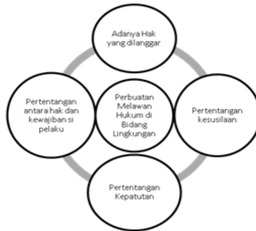
Bagan 2. Unsur Perbuatan Melawan Hukum Pada Aspek Lingkungan

Ketiga hal tersebut adalah bentuk alternative dari suatu pemaknaan perbuatan melawan hukum yang dulunya bertendensi memberikan makna yang sempit, hanya sebatas sebagai Undang-Undang.