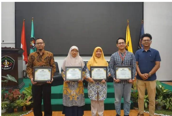
Gambar 3. Foto Bersama

Sosialisasi Study Exercise bagi Mahasiswa Program Studi Manajemen