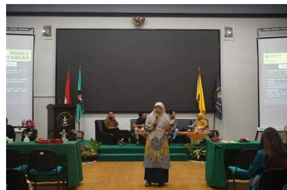
Gambar 2. Materi Konsentrasi MSDM

keberlangsungan organisasi. Mahasiswa yang memilih konsentrasi ini akan dibekali dengan pengetahuan mengenai perencanaan tenaga kerja, rekrutmen, pengembangan karyawan, manajemen kinerja, hingga hubungan industrial. Peluang karier lulusan konsentrasi MSDM di UNISKA Kediri mencakup posisi sebagai staf HR, konsultan SDM, manajer personalia, maupun praktisi pengembangan organisasi. Dengan meningkatnya kebutuhan perusahaan terhadap tenaga kerja yang kompeten, konsentrasi MSDM menjadi pilihan strategis bagi mahasiswa yang tertarik pada pengelolaan manusia dalam organisasi.