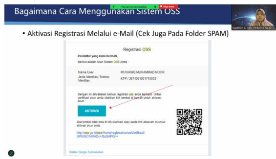
Gambar 3. Penjelasan Kepada Peserta Cara Aktivasi dan Registrasi di System OSS RBA

“AKTIVASI”. Penjelasan cara aktivasi dan registrasi di system OSS RBA, dapat dilihat pada Gambar 3. Setelah berhasil aktivasi dan registrasi, peserta akan mendapatkan konfirmasi username dan password yang dikirimkan melalui email. Jika peserta tidak menemukan email konfirmasi di kotak masuk, peserta dapat melakukan check di bagian spam. Penjelasan mengenai konfirmasi username dan password, dapat dilihat pada Gambar 4.