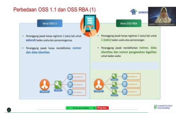
Gambar 2. Penjelasan Tentang OSS Versi 1.1 dan OSS RBA pada Peserta

OSS telah bertransformasi dari OSS versi 1.1 tahun 2019 dan OSS RBA ( Risk Based Approach ) tahun 2021. OSS versi 1.1 belum berdasarkan risiko usaha. Sedangkan OSS RBA ini akan menilai permohonan perizinan berusaha pada tingkatan risiko dan besaran skala usaha yang dijalankan. Official launching OSS RBA diresmikan pada tanggal 09 Oktober 2021 di Jakarta. Usaha dengan tingkat risiko rendah seperti UMK hanya memerlukan NIB. Usaha dengan tingkat risiko menengah memerlukan NIB + sertifikat standar usaha. Usaha dengan tingkat risiko tinggi memerlukan NIB + izin produk + sertifikat standar produk (jika diperlukan). Sistem OSS RBA dibangun sejak Maret 2021 dengan mengintegrasikan sistem OSS yang ada di tingkat Kabupaten/Kota, Provinsi, hingga di Kementerian/Lembaga dengan sistem OSS yang ada di pusat Kementerian Investasi/Badan Koordinasi Penanaman Modal (BKPM) (Angkareda, 2025). Penjelasan mengenai perbedaan OSS versi 1.1 dan OSS RBA kepada peserta, dapat dilihat pada Gambar 2.