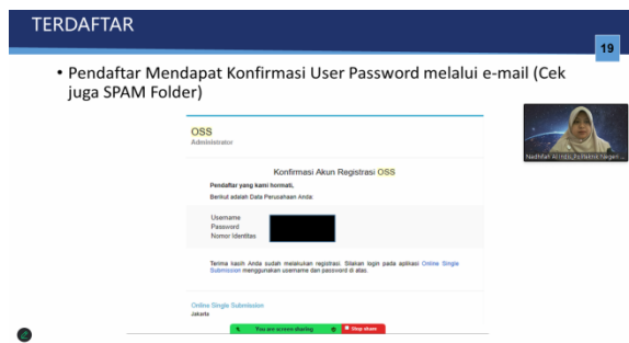
Gambar 4. Penjelasan Kepada Peserta Tentang Konfirmasi Username dan Pasword

Langkah selanjutnya adalah melengkapi data diri, yaitu nomr NIK yang terdaftar sebagai pengurus perusahaan, nama lengkap, alamat, tanggal lahir, email aktif, dan sebagainya. Setelah semuanya lengkap dilanjutkan dengan klik “Perizinan Berusaha” dan memilih KBLI (Klasifikasi Baku Lapangan Usaha Indonesia). KBLI bisa dilihat di laman OSS juga atau bisa dicari di google dengan cara klik