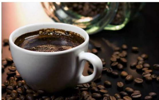
Gambar 1. Kopi Seduh Pagi (Harianto dkk., 2022)

Pendampingan pembuatan NIB ini, bermula dari diskusi ringan antara dosen POLIJE dengan 9 pemuda-pemudi yang akan menjalankan sebuah usaha café. Berdasarkan diskusi tersebut, lahirlah sebuah permasalahan atau kendala tentang pengurusan perizinan berusaha, diantaranya adalah: