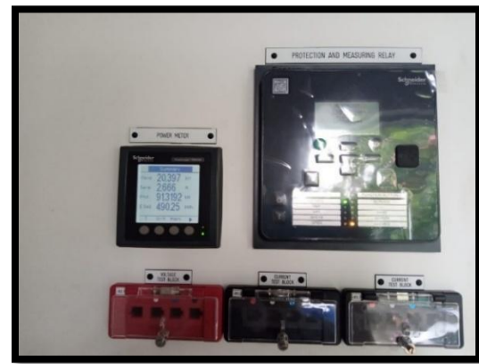
Gambar 3. Monitoring dan Kontrol Cubicle Pelanggan

Hasil ini mengatasi bottleneck operasional sekaligus menyediakan cadangan daya 13.5% untuk ekspansi masa depan (Widodo et al., 2023).