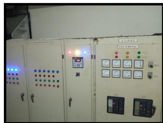
Gambar 4. LVMDP dan Kapasitor Bank Control

Pengujian komisioning membuktikan peningkatan kualitas daya yang signifikan, diantaranya; Faktor daya naik dari 0.82 → 0.98 yang berdampak mengurangi rugi-rugi daya reaktif, Harmonisa turun dari 12% → 4.8% (di bawah batas aman IEEE 519-2014), Waktu transfer ATS 8 detik (lebih cepat 20% dari standar industri 10 detik), Grounding 0.78 Ω (batas standar PUIL 5Ω). Panel Low Voltage Main Distribution Panel (LVMDP) serta panel kontrol kapasitor bank ditunjukkan pada gambar 4.