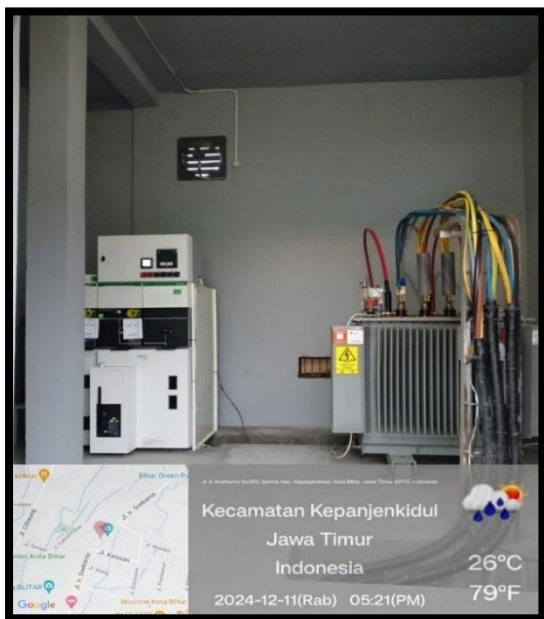
Gambar 2. Cubicle dan Transformator 630kVA

Proyek pendampingan berhasil meningkatkan kapasitas daya dari 345 kVA menjadi 555 kVA melalui pemasangan transformator 630 kVA, disertai perangkat pendukung kritis: Cubicle Schneider SM6-IM (proteksi busur api SF6, rated impulse current 12.5 kA), Kapasitor bank 170 kVAR dengan filter harmonik, Kabel TM NZXSY 3x35 mm 2 dan TR NYFGBY 4x150 mm 2 yang memenuhi standar ketahanan isolasi >1000 MΩ (megger 5 kV). Gambar 2 hasil pemasangan cubicle dan transformator pada gardu induk pelanggan.