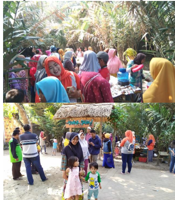
Gambar 6. Pengunjung Pasar jajan ngisor Wit Salak Dewasarejo

memanfaatkan liburan sebagai sarana untuk mempererat kembali ikatan keluarga.