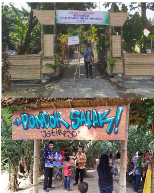
Gambar 1. Gapuro DEWASAREJO, atas: gapuro depan gang masuk, bawah: gapuro depan kebun

Pembangunan Desa Wisata dilakukan di lokasi terpilih. Pada spot ini, dibangun sebuah gapuro Selamat Datang yang bisa dilihat dari depan gang yang menghadap ke jalan desa. Jalanan paving dalam gang masuk digambar dan dicat sedemikian rupa agak lebih menarik tampilannya. Di bagian depan kebun diberi sebuah gapuro kecil sebagai pintu masuk kebun salak seperti terlihat pada gambar 1.