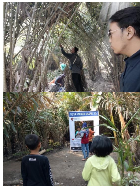
Gambar 2. Kondisi kebun salak, atas: sebelum dibersihkan, bawah: setelah dibersihkan.

Di dalam kebun salak yang telah dibersihkan, diisi dengan bedak meja untuk para penjual jajan tradisional, panggung hiburan dan spot swafoto seperti gambar 2.