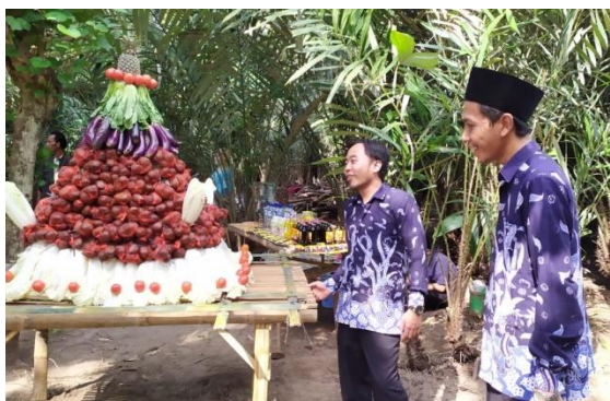
Gambar 3. Gunung salak dalam acara Festival Salak untuk pembukaan DEWASAREJO

Penyelenggaraan festival salak dilakukan dengan beberapa rangkaian acara, diantaranya membuat gunung salak yang diarak oleh warga. Salak disusun sedemikian rupa dalam bentuk sebuah gunung dan dikombinasikan dengan segala uborampunya (Gambar 3). Dalam festival salak yang diadakan, turut hadir Bupati selaku pemda Jombang beserta jajarannya, Dinas Pertanian dan perangkat desa Jatirejo beserta jajarannya. Festival salak menjadi penanda dibukanya Dewasarejo sekaligus promosi untuk memperkenalkan Dewasarejo kepada masyarakat Jombang dan sekitarnya. Bersamaan dengan festival salak, juga mulai dibuka Pasar Jajan Ngisor Wit Salak yang berada di dalam lokasi Dewasarejo.