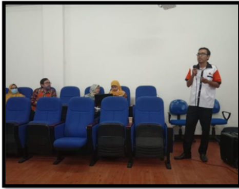
Gambar 5. Penyampaian Materi DOAJ

Narasumber menyampaikan 11 (sebelas) item yang perlu disiapkan sebuah jurnal sebelum mendaftar di DOAJ seperti tabel 3 di bawah.