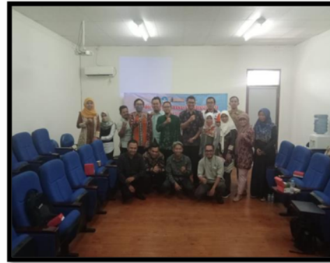
Gambar 6. Foto Bersama Peserta dan Narasumber

Kegiatan terakhir adalah tanya jawab dan diskusi oleh peserta kepada narasumber. Semua peserta memiliki peluang/kesempatan untuk bertanya mengenai materi. Kemudian dari hasil kegiatan workshop ini sampai ditulisnya artikel ini diperoleh hasil bahwa sebanyak 12 jurnal UNISKA yang telah terakreditasi SINTA sebagaimana tabel 4 dan baru 1 jurnal yang terindeks di DOAJ. Semoga semua jurnal UNISKA bisa terakreditasi dan terindeks di DOAJ. Kegiatan diakhiri dengan foto bersama seperti pada gambar 6.