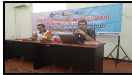
Gambar 3. Penyampaian Materi Akreditasi Jurnal

Setelah menyampaikan aturan unsur penilaian akreditasi jurnal maka dilakukan bedah jurnal untuk beberapa jurnal yang ada lingkungan Universitas Islam Kadiri yang salah satu jurnal yaitu JMK (Jurnal Manajemen dan Kewirausahaan). Kegiatan bedah jurnal ini untuk mengetahui kekurangan baik tata kelola jurnal maupun tampilan OJS agar dapat segera diperbaiki dan mendapatkan hasil maksimal saat akreditasi. Dokumentasi kegiatan penyampaian kegiatan materi akreditasi Jurnal seperti pada gambar 3.