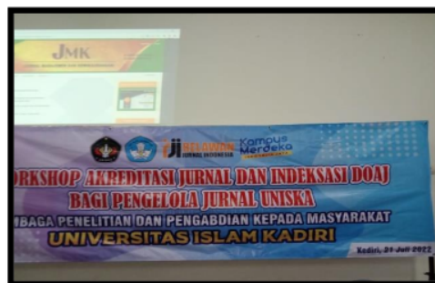
Gambar 1. Banner Workshop Akreditasi Jurnal dan Indeksasi DOAJ