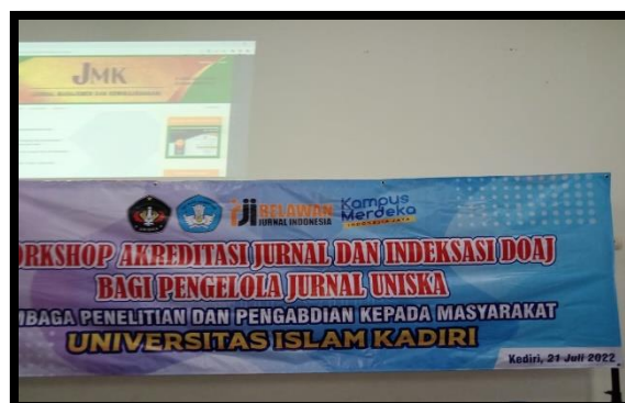
Gambar 1. Banner Workshop Akreditasi Jurnal dan Indeksasi DOAJ