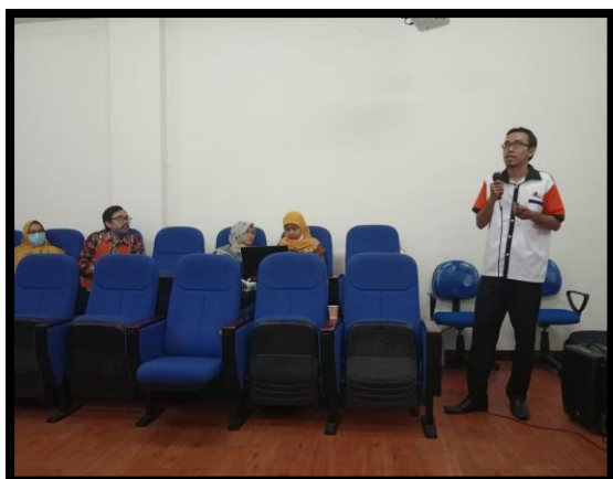
Gambar 5. Penyampaian Materi DOAJ

Narasumber menyampaikan 11 (sebelas) item yang perlu disiapkan sebuah jurnal sebelum mendaftar di DOAJ seperti tabel 3 di bawah.