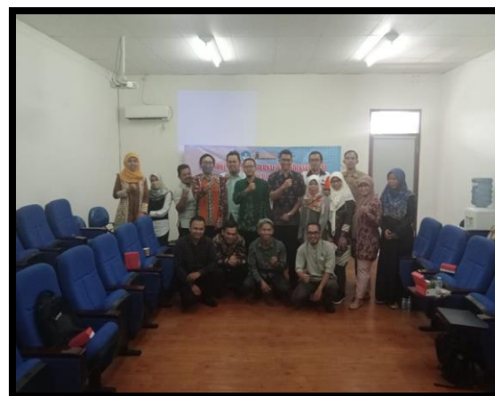
Gambar 6. Foto Bersama Peserta dan Narasumber

Kegiatan terakhir adalah tanya jawab dan diskusi oleh peserta kepada narasumber. Semua peserta memiliki peluang/kesempatan untuk bertanya mengenai materi. Kemudian dari hasil kegiatan workshop ini sampai ditulisnya artikel ini diperoleh hasil bahwa sebanyak 12 jurnal UNISKA yang telah terakreditasi SINTA sebagaimana tabel 4 dan baru 1 jurnal yang terindeks di DOAJ. Semoga semua jurnal UNISKA bisa terakreditasi dan terindeks di DOAJ. Kegiatan diakhiri dengan foto bersama seperti pada gambar 6.