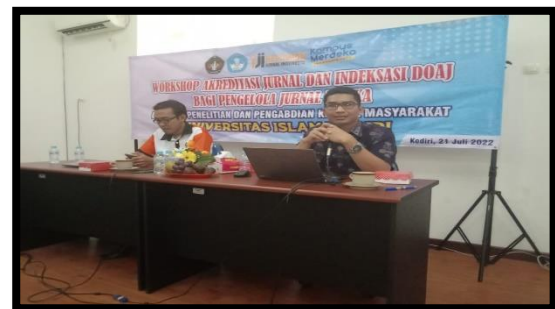
Gambar 3. Penyampaian Materi Akreditasi Jurnal

Setelah menyampaikan aturan unsur penilaian akreditasi jurnal maka dilakukan bedah jurnal untuk beberapa jurnal yang ada lingkungan Universitas Islam Kadiri yang salah satu jurnal yaitu JMK (Jurnal Manajemen dan Kewirausahaan). Kegiatan bedah jurnal ini untuk mengetahui kekurangan baik tata kelola jurnal maupun tampilan OJS agar dapat segera diperbaiki dan mendapatkan hasil maksimal saat akreditasi. Dokumentasi kegiatan penyampaian materi akreditasi Jurnal seperti pada gambar 3.