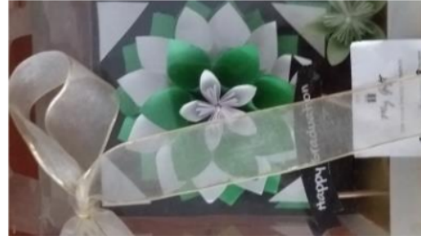
Gambar 1. Produk My Gift

membuat kerajinan serta pemahaman bisnis online produk handmade . Gambar 1 merupakan produk dari My Gift Souvenirs yang ditawarkan di instagram secara online.