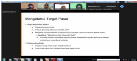
Gambar 8. Presentasi Ibu Dyah, M.Sc.

Narasumber digital marketing disam-paikan oleh Dyah Ari Susanti, ST, M.Sc. Sos 1 media untuk marketing antara lain: 1) Research and know your audience. 2) Pick your Social Platforms. 3) Pick your KPIs. 4) Write a Social Media Playbook. 5) Align your company with your plan. 6) Schedule an hour each week to Schedule post. 7) Create a Content Bank. 8) Post Relevant Content. 9) Treat All Social Channels Separately. 10) Do Reporting and Reanalyzing. Narasumber kesimpulan kewirausahaan - Isna Indriyani.