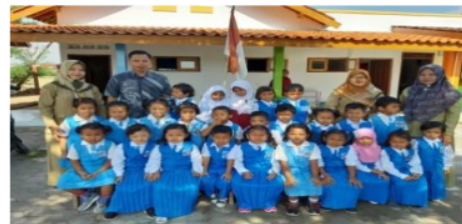
Gambar 2 Ibu Guru TK Dukuh 02

Kondisi awal mitra pengabdian adalah mitra ibu guru TK Dukuh 02 tertarik untuk memiliki pengalaman kegiatan pengabdian dari civitas akademika khususnya tim pengabdian Universitas Sarjanawiyata Tamansiswa, para ibu guru TK Dukuh 02 dapat berkesempatan mengembangkan ketrampilan dalam membuat karya kerajinan khususnya pita dan bunga kertas serta ilmu manajemen keuangan digital. Ibu guru TK Dukuh 02 juga memiliki keterbatasan kerajinan handmade pita dan bunga kertas serta manajemen keuangan digital. Peningkatan ketrampilan dari hasil pelatihan program pengabdian dapat diajarkan ulang kepada siswa TK sehingga siswa TK dapat meningkatkan semangat belajar. Ibu guru TK Dukuh 02 memiliki sikap yang optimis dan positif dalam menggapai cita-cita pendidikan anak usia TK, hal ini terlihat pada gambar 2 dimana terlihat kekompakan diantara ibu guru TK dan siswa TK dalam acara sesi Foto bersama.