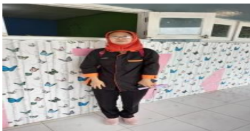
Gambar 5. Observasi