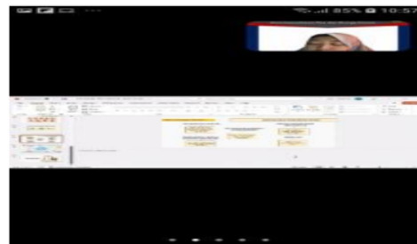
Gambar 7. Presentasi Ibu Uum, M.Si

Kerawanan Fintech antara lain: 1) Kesalahan Transaksi. 2) Kegagalan sistem. 3) Kesulitan akses jaringan internet. 4) Keamanan data pribadi. 5) Kesalahan informasi. 6) Penanganan pengaduan konsumen. 7) Cyber crime : Kriminal Dunia maya.