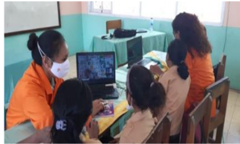
Gambar 2. Pendampingan yang dilakukan mahasiswa pada siswa kelas V

lajari soal-soal ujian nantinya sekaligus cara mengisi identitas saat ANBK berlangsung.