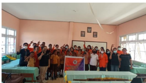
Gambar 5. Foto bersama tim dosen dan mahasiswa UNIPA bersama kepala sekolah dan siswa

Keberhasilan dari kegiatan pendampingan yang dilakukan Tim dosen 10 dan mahasiswa fakultas Teknik UNIPA tidak lepas dari beberapa faktor pendukung maupun faktor penghambat. Lancarnya pendampingan yang dilaksanakan tidak lepas dari tingginya antusiasme dari warga SDK Maumere 2, khususnya siswa-siswi kelas V, yang akan mengikuti ANBK. Antusiasme siswa terlihat dari banyaknya pertanyaan-pertanyaan yang diajukan dan tidak adanya siswa yang membolos selama kegiatan pendampingan dilakukan. Hambatan yang dianggap sebagai kendala dalam kegiatan ini adalah adanya hambatan gangguan internet sehingga memperlambat proses, untuk siswa dapat bergabung dengan akun yang telah ditentukan dalam kegiatan ANBK.