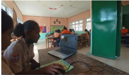
Gambar 3. Tes penguasaan dalam menggunakan perangkat keras

pengisiannya pada lembar jawaban ketika ujian berlangsung. Test yang dilakukan antara lain: 1) Test penguasaan perangkat keras seperti mouse, keyboard. 2) Cara mengetik pada keyboard dan mengarahkan mouse.