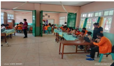
Gambar 1. Metode BYOD yang diterapkan pada SDK Maumere 2

rangi biaya sekolah, menghemat anggaran dalam pengadaan perangkat keras, perangkat lunak, dan dapat meningkatkan mobilitas, fleksibilitas, produktivitas dan kepuasan siswa dalam pembelajaran. Penerapan BYOD ini diterapkan oleh mahasiswa dan Dosen Fakultas Teknik dengan membawa sendiri perangkat elektronik yang kemudian dimanfaatkan oleh setiap siswa SDK Maumere 2. Selain membawa, setiap dosen dan mahasiswa langsung bertugas memberikan pengajaran perihal cara menggunakan perangkat komputer dan mampu mengoperasikannya dengan baik.