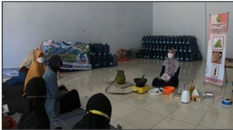
Gambar 1. Penyuluhan Diversifikasi Produk Olahan Jagung

pengalaman, acara, orang, tempat, properti, organisasi, informasi, dan ide. Tak hanya dapat memperpanjang masa simpan produk, adanya diversifikasi produk olahan jagung dapat meningkatkan nilai tambah jagung yang selama ini hanya dijual utuh dalam bentuk segar dan kering. Selain itu, produk olahan ini diharapkan dapat membantu upaya pemberdayaan perempuan di Desa Maskuning Kulon, terutama terkait dengan peningkatan perekonomian masyarakat.