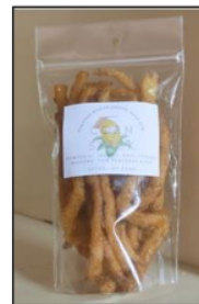
Gambar 4. Produk Stik Jagung