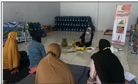
Gambar 2. Pelatihan Pembuatan Stik Jagung

Karena adanya pembatasan kegiatan berkumpul akibat penyebaran Covid-19 yang signifikan, maka kegiatan penyuluhan mengenai cara pembuatan dan pengemasan stik jagung dilakukan sekaligus pada saat pelatihan berlangsung (Gambar 1 dan Gambar 2). Pada kegiatan penyuluhan, para peserta diberikan brosur yang berisi materi mengenai deskripsi dan manfaat jagung, serta modifikasi produk dengan berbagai bahan sayuran atau bagian tanaman lainnya yang diketahui berguna bagi kesehatan, potensi pengembangan produk yang bernilai jual