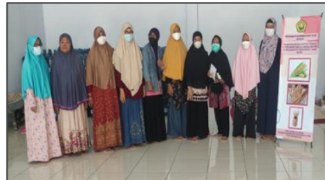
Gambar 3. Foto Bersama Peserta Kegiatan

Peserta kegiatan juga dilatih cara pengemasan produk olahan jagung tersebut. Mulai dari jenis bahan pengemas yang dapat mempertahankan kualitas produk pangan hingga pelabelannya agar produk memiliki masa simpan yang panjang, disertai tampilan yang menarik. Dengan kemasan yang menarik, diharapkan dapat meningkatkan omzet penjualan produk tersebut. Menurut BPOM (2020), kemasan pangan berperan untuk melindungi produk dari kontaminasi, menjaga kualitas dan memperpanjang masa simpan, sehingga kemasan harus dapat melindungi produk dari pengaruh lingkungan dan pengaruh fisik. Kemasan juga berperan dalam memenuhi keinginan konsumen, memperluas pangsa pasar, meningkatkan nilai jual, membuat produk menjadi unik, dan memudahkan kegiatan distribusi dan transportasi. Karenanya, pada Peraturan Badan POM No. 20 Tahun 2019 tentang Kemasan Pangan telah dijelaskan tentang kemasan pangan yang dapat beredar, aman, dan tidak membahayakan kesehatan.