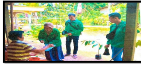
Gambar 8. Pemberian bibit

Masyarakat desa Krosok sangat terbantu dengan adanya kegiatan KKN. Dengan waktu pelaksanaan KKN selama 1 bulan diharapkan masyarakat desa Krosok mendapatkan pengetahuan dan wawasan tentang bagaimana mengubah cara kerja tradisional kepada cara kerja yang lebih modern serta mengembangkan potensi-potensi lokal yang ada di desa Krosok setelah KKN berakhir.