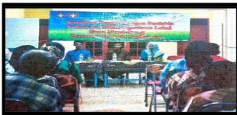
Gambar 3. Praktek pembuatan pestisida nabati

Kegiatan dilaksanakan pada tanggal 26 Agustus 2017 bertempat di balai desa dengan narasumber Bpk. Agusdin Dharma Fefirenta S.P., M.Sc dan Bpk. Imam Habibi S.P., M.Sc. Sasaran kegiatan adalah kelompok tani desa Krosok. Tujuan kegiatan memberikan edukasi pertanian yang ramah lingkungan dengan menggunakan pestisida nabati dan mikroorganisme lokal. Hasil yang dicapai adalah kelompok tani mampu memahami dan mempraktikkan pembuatan pestisida nabati tersebut.