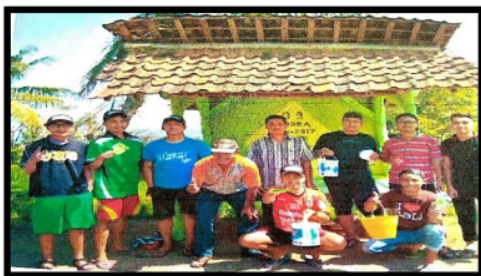
Gambar 7. Perbaikan poskamling desa

Mahasiswa KKN juga turut serta melakukan kegiatan yang sifatnya partisipatif dengan pembangunan sarana prasarana desa Krosok seperti kerja bakti yang dilaksanakan setiap minggu pada hari Minggu bersama warga desa Krosok. Bersama warga desa memperbaiki poskamling, perawatan balai desa, kegiatan keagamaan seperti pengajian dengan warga dan mengajar di TPQ, serta pemberian bibit cabai dan bibit durian untuk meningkatkan pertanian desa Krosok.