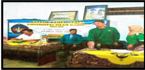
Gambar 2. Praktek pembuatan silase pakan hijauan ternak

agar peternak dapat memanfaatkan sisa hasil pertanian menjadi pakan hijauan ternak yang berkualitas tinggi dan tahan lama memiliki kadar protein tinggi serta meningkatkan ekonomi masyarakat apabila pakan tersebut dijual.