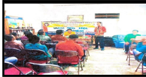
Gambar 4. Sosialisasi UMKM dan manajemen keuangan sederhana

MM. Sasaran kegiatan ini adalah UMKM yang ada di desa Krosok. Tujuan kegiatan untuk memberi edukasi bagi pelaku UMKM bagaimana mengelola keuangan dengan baik dan menyusun laporan keuangan sederhana. Hasil yang dicapai adalah pelaku UMKM memahami pentingnya manajemen keuangan yang baik.