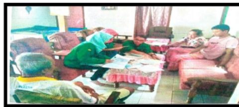
Gambar 5. Sosialisasi pentingnya arsip keluarga

Kegiatan dilaksanakan pada tanggal 27 Agustus 2017 secara langsung dengan berkunjung ke beberapa rumah warga desa Krosok. Mahasiswa KKN menyampaikan kepada anggota keluarga dalam hal ini bapak/ibu anggota keluarga agar mengelola dana menyimpan arsip atau dokumen keluarga dengan benar. Tujuan kegiatan ini untuk meningkatkan kesadaran masyarakat desa Krosok tentang pentingnya menjaga arsip atau dokumen keluarga. Hasil yang dicapai adalah masyarakat memahami ilmu kearsipan dan menerapkannya baik di rumah atau tempat kerja.