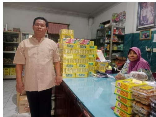
Gambar 3. Penyuluhan Perpajakan Pada UMKM Brem Candi Mas