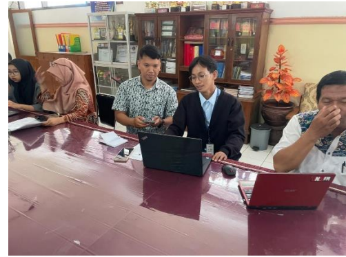
Pengisian SPT di Tax Center Unmer Madiun