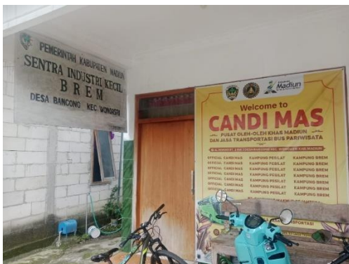
Gambar 2. Sentra Industri Kecil Brem Desa Bancong, Kecamatan Wonoasri, Kabupaten Madiun

UMKM Brem Candi Mas merupakan anggota Sentra Brem yang terletak di desa Bancong, kecamatan Wonoasri, kabupaten Madiun. Perusahaan ini mempunyai 2 merek brem, yaitu Candi Mas dan Suling Mas Super. UMKM Brem Candi Mas kurang memahami tentang perpajakan dan pelaporan perpajakan tahunan tahun 2025 dengan sistem Coretax. UMKM Brem Candi Mas memanfaatkan fasilitasi oleh Tax Center Universitas Merdeka Madiun untuk laporan SPT tahunan.