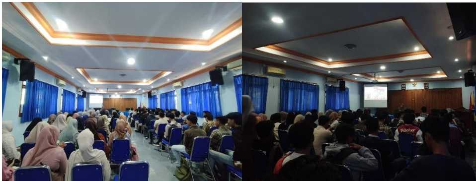
Gambar 3. Pemaparan Materi Terkait Investasi Dan Proses Investasi Saham Pada Aplikasi Mitra Galeri Investasi FEB UNIRA

dunia nyata kepada para peserta. Mereka menyimak dengan penuh perhatian selama pemaparan materi dan menunjukkan antusiasme tinggi terlihat dari banyaknya pertanyaan yang diajukan terkait perbedaan saham dan Reksadana serta bagaimana caranya melakukan pemilihan saham yang tepat untuk investasi. Setelah sesi pertama, peserta diberikan waktu istirahat ( coffee break ) selama 10 menit. Waktu istirahat ini juga dimanfaatkan oleh peserta untuk berdiskusi informal dengan narasumber dan sesama peserta, menciptakan suasana pembelajaran yang lebih santai dan interaktif. Sesi kedua fokus pada mekanisme investasi dan cara pemilihan saham. Narasumber menjelaskan langkah-langkah membuka rekening efek, cara melakukan transaksi jual beli saham dengan menggunakan mitra Galeri Investasi Bursa Efek Indonesia yakni Phintraco Sekuritas dengan aplikasi profit Anyware untuk memperjelas implemtasi materi dengan mendemotrasikan langsung dengan apliaksi. Pada kegiatan ini memebrikan kesempatan bagi peserta untuk mencoba langsung mengenai aplikasi untuk investasi. Pada sesi kedua Antusiasme peserta semakin meningkat karena mereka dapat melihat secara langsung bagaimana proses investasi saham dilakukan.