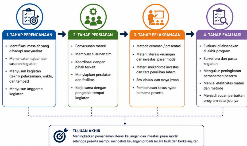
Gambar 1. Diagram Tahapan Pelaksanaan Kegiatan Pengabdian Kepada Masyarakat

Tahapan pelaksanaan kegiatan pengabdian kepada masyarakat disajikan pada Gambar 1. Diagram tersebut menjelaskan alur kegiatan yang terdiri atas tahap perencanaan, persiapan, pelaksanaan, dan evaluasi sebagai upaya meningkatkan literasi keuangan dan pemahaman investasi pasar modal pada generasi muda di Kabupaten Pamekasan.