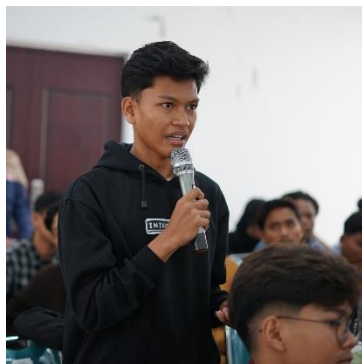
Gambar. 4 Sesi DiskusiTanya Jawab Dengan Peserta Mengenai Investasi

Setelah penyampaian materi, kegiatan dilanjutkan dengan sesi diskusi dan tanya jawab. Pada sesi ini, narasumber mengangkat beberapa kasus nyata terkait kesalahan umum yang dilakukan investor pemula, seperti tergiur investasi bodong, membeli saham berdasarkan rumor, dan panic selling saat harga saham turun. Peserta aktif berdiskusi dan memberikan pendapat mereka tentang bagaimana seharusnya menghadapi situasi tersebut.