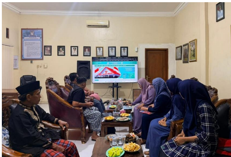
Gambar 2. kegiatan observasi awal

Sebagai bentuk dokumentasi kegiatan, dilakukan pengambilan foto pada setiap tahapan pelaksanaan. Foto 2 menunjukkan kegiatan observasi awal bersama pengurus koperasi, yang memperlihatkan proses diskusi mengenai kondisi administrasi yang ada pemaparan materi dan praktik pencatatan administrasi secara langsung. Dokumentasi ini menjadi bukti pelaksanaan kegiatan sekaligus sebagai bagian dari laporan pengabdian.