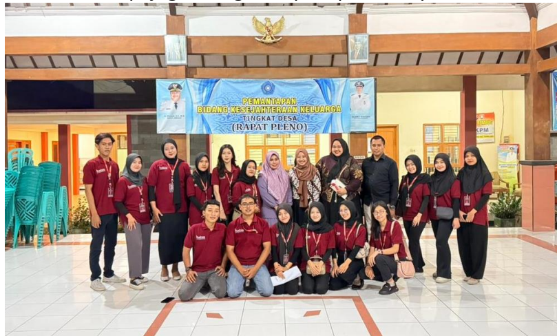
Gambar 2. Pembekalan Micro-Resilience Fund (MRF) pada Mahasiswa KKN

berlangsung. Temuan ini menjadi dasar penting dalam merancang intervensi yang tidak hanya menyelesaikan masalah, tetapi juga mengubah pola pikir masyarakat.