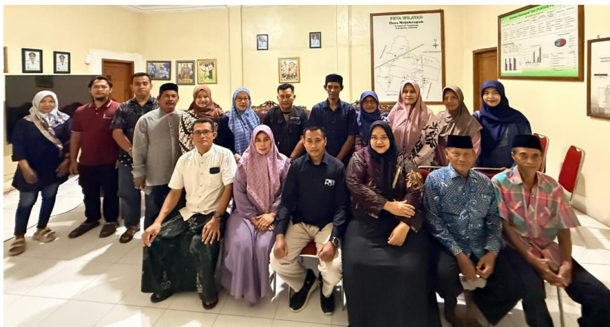
Gambar 3. Penyuluhan Micro-Resilience Fund (MRF) berbasis PKK kepada Stakeholder Desa Mojokrapak

Pada tahap penyuluhan, pendekatan yang digunakan adalah penyuluhan lisan secara partisipatif, yang terbukti efektif dalam meningkatkan pemahaman anggota PKK. Proses pendampingan pada tahap ini tidak hanya berfokus pada penyampaian materi, tetapi juga pada interaksi langsung yang memungkinkan terjadinya diskusi dan refleksi bersama. Hasilnya menunjukkan adanya perubahan pola pikir dari yang sebelumnya berorientasi pada penanganan pascabencana menjadi kesiapsiagaan sebelum bencana terjadi. Hal ini menegaskan bahwa edukasi yang kontekstual dan komunikatif mampu mendorong perubahan sikap masyarakat secara lebih efektif.