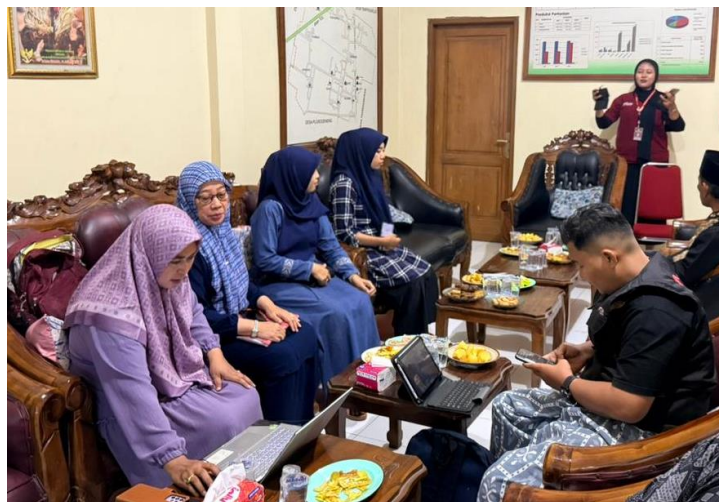
Gambar 4. Proses Evaluasi Penyusunan Micro-Resilience Fund (MRF) Berbasis PKK

Pada tahap evaluasi, kegiatan pengabdian ini menghasilkan output yang nyata berupa meningkatnya pemahaman, terbentuknya kesepakatan komunitas, serta kesiapan PKK dalam mengelola dana gotong royong untuk mitigasi bencana. Output utama dari kegiatan ini adalah terbentuknya konsep Micro-Resilience Fund berbasis PKK sebagai sistem keuangan komunitas yang bersifat preventif. Selain itu, kegiatan ini juga menghasilkan peningkatan literasi keuangan masyarakat, penguatan kelembagaan PKK sebagai pengelola dana, serta adanya komitmen untuk melakukan iuran rutin sebagai bentuk kesiapsiagaan. Dengan demikian, kegiatan pengabdian ini tidak hanya menghasilkan perubahan pengetahuan, tetapi juga perubahan perilaku dan sistem yang mendukung ketahanan finansial komunitas secara berkelanjutan.