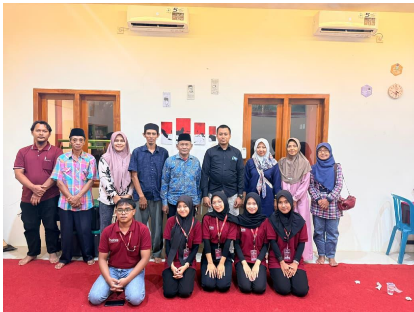
Gambar 3. Pelaksanaan Pendampingan Administratif Kepada Seluruh Anggota BUMDes Maju Makmur Di Desa Mojokrapak