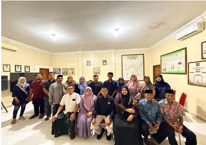
Gambar 2. Sosialisasi Persiapan Pendampingan Administratif Kepada Seluruh Anggota BUMDes Maju Makmur Di Desa Mojokrapak