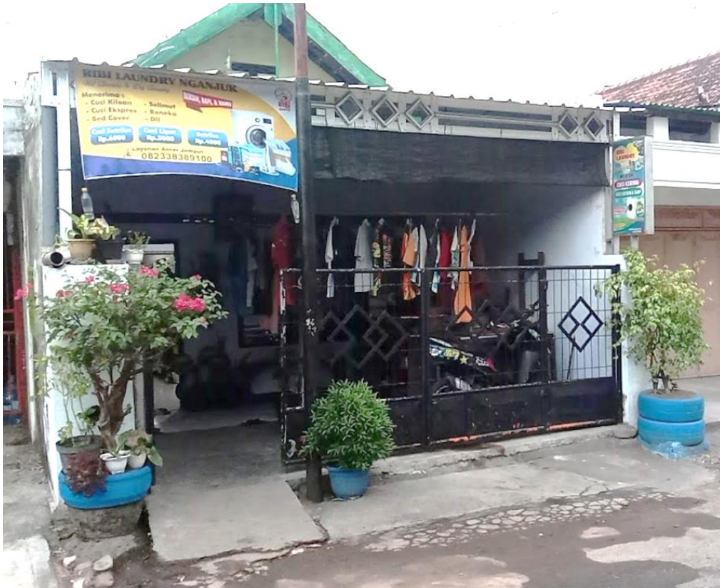
Usaha Rumahan Ribi Laundry